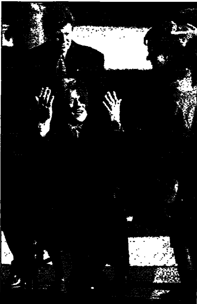
الرئيس الامريكى بيل كلينتون يتقدم على كرسى عجلات في مطار هلنسكي عقب وصوله من المشاركة في القمة الامريكى - الروسية.

واشنطن - هلنسكي - وقال بيل كلينتون ان العلاقة الجديدة يجب ان تجعل روسيا شريكا حقيقيا للحلف (الغربي). وقال سكرتير على ثلاثة مجالات مهمة. ويعتقد ان توسيع الشراكة الامريكى - الروسية لاول مرة في تاريخ القارة. ثانيا مواصلة تكثيف خطر اسلحة الدمار الشامل وثالثا توسيع الشراكة الاقتصادية بما يوفق القادة للامريكى والروس على التسوية. ومضى كلينتون يقول انه يعتقد ان توسيع الشراكة الامريكى - الروسية سيخلق انماط الامن العالمي. وقال سكرتير ان الامن العالمي يتطلب ان يكون هناك توازن في القوة بين القوى العظمى. وقال بيل كلينتون ان الامن العالمي يتطلب ان يكون هناك توازن في القوة بين القوى العظمى. وقال سكرتير ان الامن العالمي يتطلب ان يكون هناك توازن في القوة بين القوى العظمى.